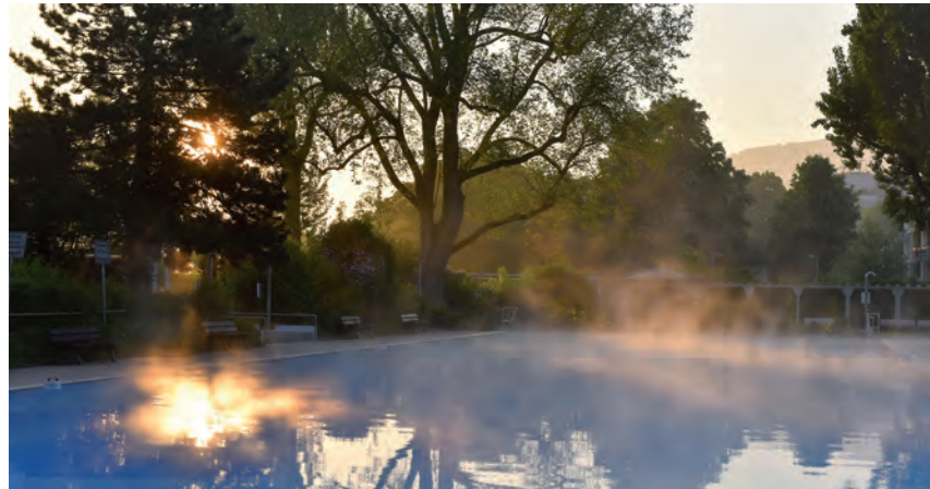
Arbeiten an einem der schönsten Arbeitsplätze Heidelbergs, z. B. wenn morgens der Nebel über den Becken im Thermalbad aufzieht. Jetzt für die Ausbildung 2024 bewerben.

Auszubildende lernen nicht nur Erste Hilfe, Wasserrettung sowie Schwimmunterricht und Aqua-Kurse zu geben. Auch stehen Heizungs-, Lüftungs- und Sanitärtechnik – inklusive Energie-