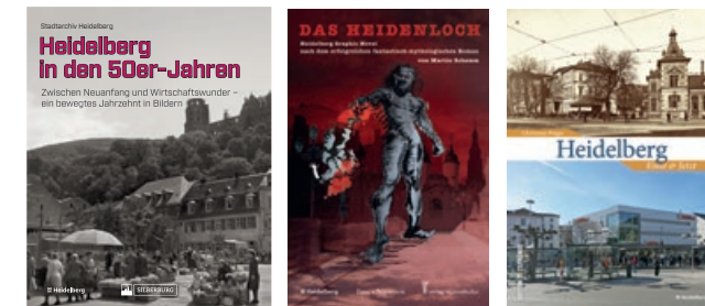
Sonderveröffentlichungen in der Schriftenreihe des Stadtarchivs

Heidenloch“ Leserinnen und Leser – dies auch als E-Book und Graphic Novel sowie als Hörspiel in Pfälzer Mundart. Seit kurzem führt der Bildband „Heidelberg in den 50er Jahren“ mit Aufnahmen des Heidelberger Fotografen Fritz Hartschuh Leserinnen und Leser hinein in das Alltagsleben eines bewegten Jahrzehnts geprägt von Nachkrieg und Neuanfang.