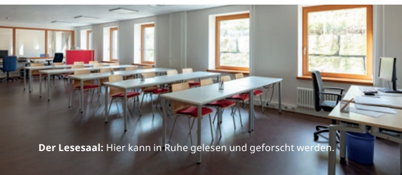
Der Lesesaal: Hier kann in Ruhe gelesen und geforscht werden.