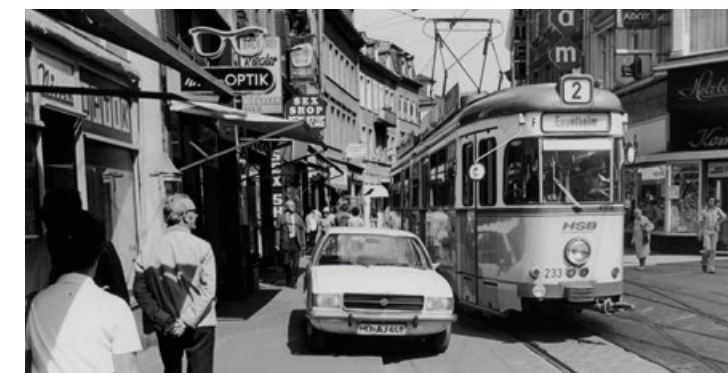
Die Heidelberger Hauptstraße in den 1970er Jahren – bevor sie zur Fußgängerzone wurde.

Dank enger internationaler Vernetzung zeigte das Archiv vielbeachtete Ausstellungen zur Architektur-, zur Brauereigeschichte und zur Flucht deutscher Juden nach Shanghai (1938–47) unter anderem in Argentinien, Chile, China und Ungarn. Führungen und andere Veranstaltungen zur Stadtgeschichte ergänzen das Angebot.