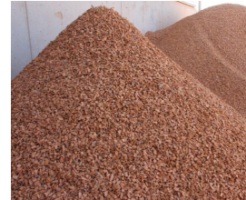
Drei unterschiedliche Arten von Ziegel im Rückbau