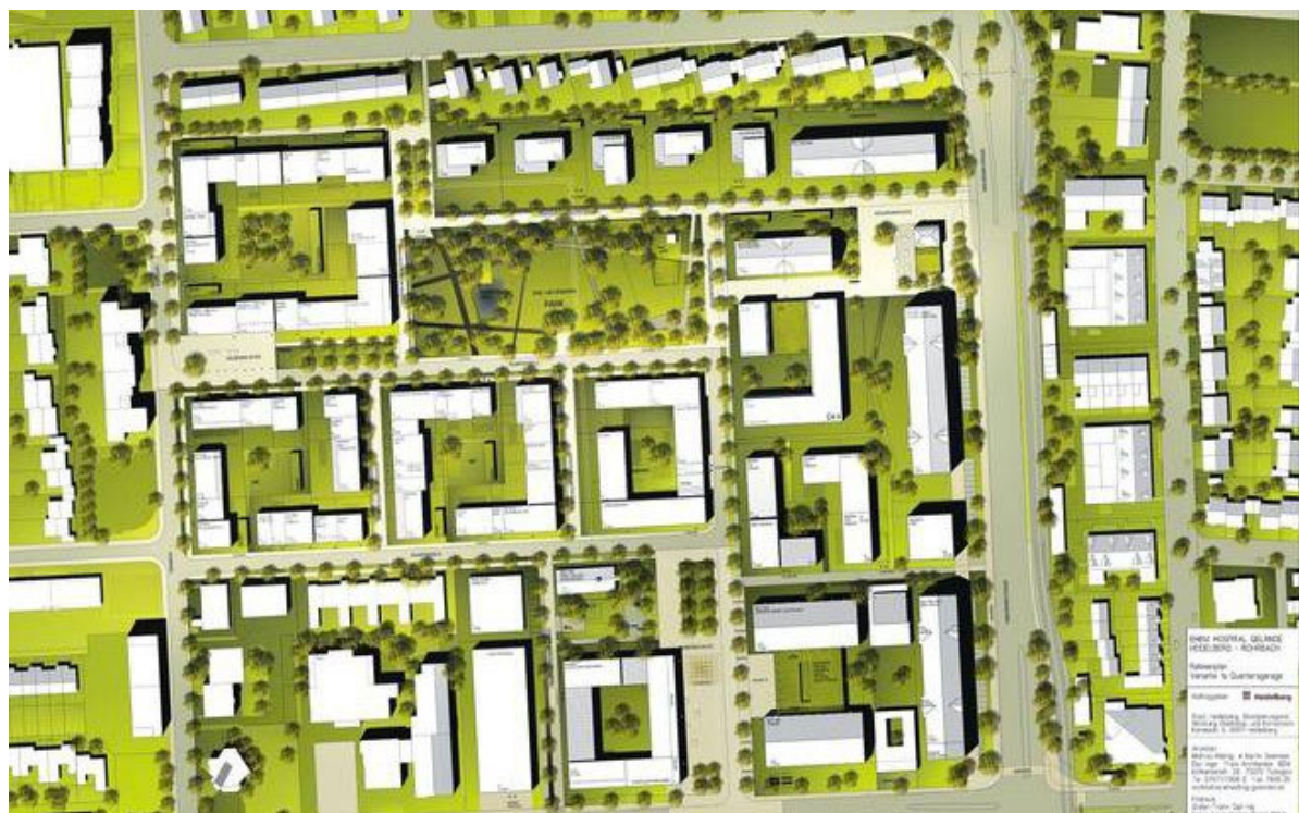
Übersicht Rahmenplan Hospital Quelle Hähnig/Gemmecke - Freie Architekten BDA, Tübingen.

hinaus informiert das Quartiersmanagement auf www.hasenleiser.net auch über Aktuelles rund um das Hospital.