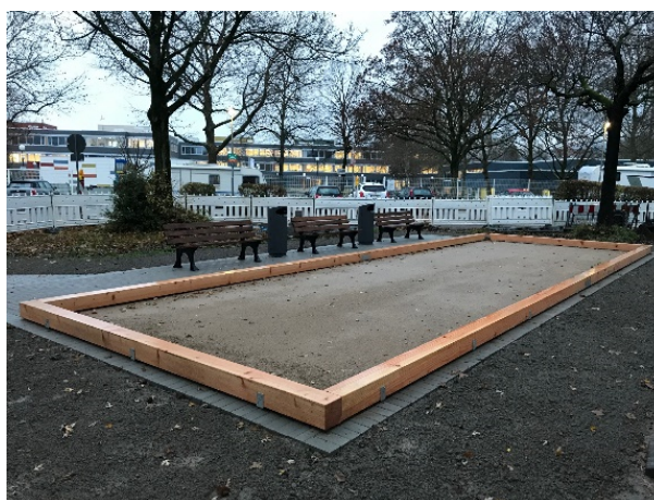
Boulebahn am Emmendinger Weg / Baden-Badener- Str.

Aus dem Quartier wurde angeregt, eine Boulebahn auf einer freien Wegerestfläche am Emmendinger-Weg / Ecke Baden-Badener-Straße zu errichten, um neben dem Seniorenzentrum einen Ort zum gemeinsamen Spiel zu schaffen. Planung und Umsetzung erfolgte durch den Regiebetrieb des Landschafts- und Forstamtes. Ende 2019 wurde der Bau abgeschlossen, die feierliche Eröffnung mit der Bewohnerschaft soll im März 2020 stattfinden. Mit der Spielstätte ist ein erster Meilenstein für die schrittweise Aufwertung der Grünflächen am Emmendinger Weg geschaffen worden.