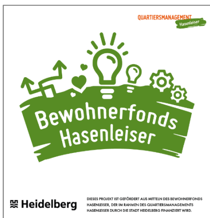
Logo des Bewohnerfonds Hasenleiser

Um den Bewohnerfonds und seine Möglichkeiten bekannter zu machen, bekam dieser in 2019 ein eigenes Logo, welches auf sämtlichen Werbeträgern mit genutzt werden soll. Zudem wurden Schilder abgestimmt, welche im öffentlichen Raum auf Projekte, die mit Hilfe des Bewohnerfonds umgesetzt wurden, hinweisen.