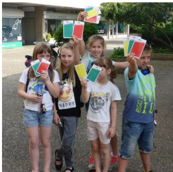
Kinderbeteiligung im Hasenleiser

Eine weitere besonders wichtige Zielgruppe sind Ältere und Menschen mit Behinderung im Quartier. Deren Unterstützung und die Schaffung von Möglichkeiten, lange selbstständig und selbstbestimmt leben zu können, tragen verschiedene Bausteine des IHK Rechnung (IHK-Maßnahme 6). 22 Prozent der Bewohnerinnen und Bewohner des Hasenleisers sind mindestens 65 Jahre alt, 12 Prozent der Bewohnerschaft über 75 Jahre.